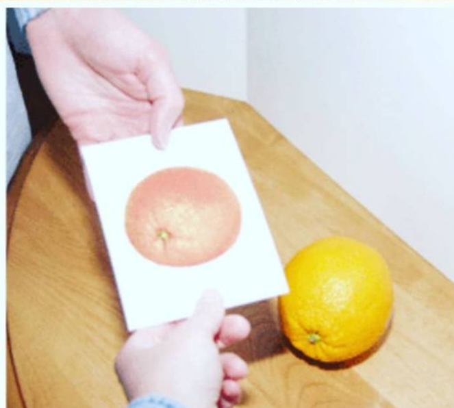
Попросить предмет карточкой